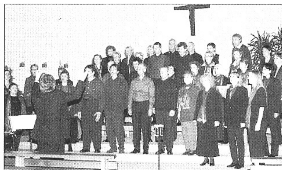
Chor-Darbietungen der Extraklasse