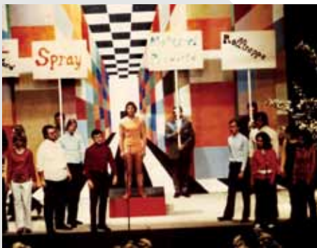
7. Mai 1972 Aufführung der Chorsatire „Warehouse Life“ im Badischen Staatstheater, Karlsruhe