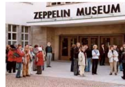
März 2005 Konzertreise Bodensee

Ein absolutes Highlight in den 40 Jahren der Chorgeschichte war unsere Reise nach New Orleans, zu der wir auf die Einladung eines schwarzen Gospelfarrers hin aufbrachen. Wir wohnten in einem traditionsreichen Hotel im Vieux Carrée, wodurch wir jeden Abend die typische Jazz- und Blues-Atmosphäre von New Orleans erleben konnten. Tagsüber lernten wir bei verschiedenen Ausflügen die Lebensweise von New Orleans kennen. So besuchten wir z.B. die typischen Friedhöfe von New Orleans, die aufgrund der Hochwasser-Gefahr ihre Särge in riesigen Grabmonumenten aufbewahren. Ostersonntag kamen wir zum eigentlichen Grund unserer Reise. Wir gestalteten mit Pater Jerome den Ostergottesdienst - einen typisch schwarzen Gottesdienst, bei dem wirklich gefeiert, getanzt und gesungen wurde.