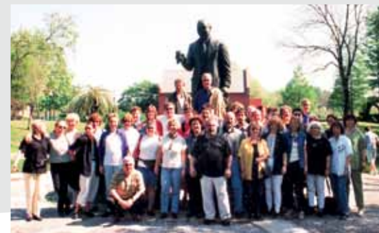
31. März bis 6. April 1999 Chorreise nach New Orleans

27. Oktober bis 3. November 2001 Chorreise in die neuen Bundesländer